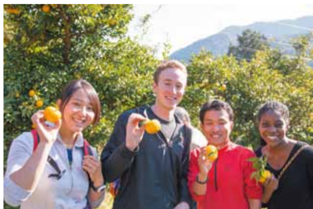
当日は海外からのお客様もいらっしゃいました♪

紅葉に色づいた季節もいよいよ終わりに近づき、森には凜とした透き通る空気流れ、東京の山々にも冬の足音が。私が担当する街ブレの紙面も今年、最後の号となりました。ご愛読頂いている皆様、1年間本当にありがとうございました！また来年も東京は御岳から、皆様へ旬な情報をお届けしてまいります！